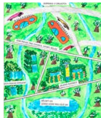
ZŠ Březinova – Zelený Jih