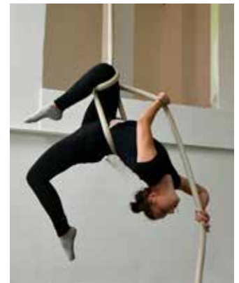
Loni obdržel dotaci také Cirkus trochu jinak.

Bližší informace k vyhlášenému dotačnímu programu, semináři a elektronické formuláře lze najít na internetových stránkách obvodu: ovajih.cz v sekci Účelové dotace.