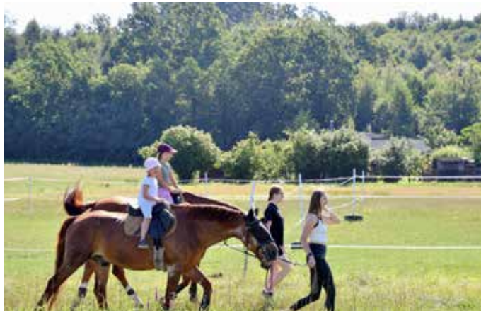
Letos poprvé se do projektu zapojil Jezdecký klub Baník Ostrava.

Akce probíhá až do 31. srpna, přičemž pro školáky z Jihu jsou na každý pracovní den nachystány různorodé aktivity. Ty