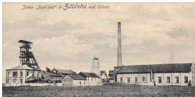
Důl Bedřich na pohlednici z roku 1905. Pohlednice je však stranově převrácena oproti realitě.

Těžní jáma o průměru 5,6 metru se začala hloubit 1. dubna 1900. Přítok vody v jámě činil okolo 180 litrů za minutu. Dále byla postavena těžní budova, strojovna, kotelna, cechovna, separace, skladiště a jiné menší objekty.