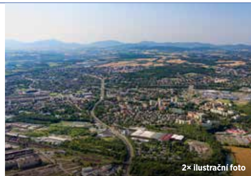
2× ilustrační foto