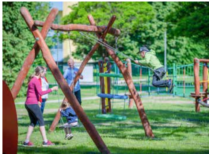
Otevřená hřiště jsou místem, kde je možné si odpočinout, ale také se dostatečně zabavit.

S koncem školního roku bylo ukončeno podávání návrhů letošního participativního rozpočtu. Tentokrát se jich na radnici sešlo 39.