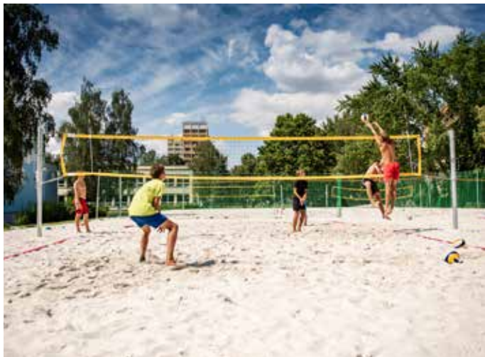
Rekreační i profesionální hráči mají v areálu ZŠ A. Kučery k dispozici tři beachvolejbalové kurty.