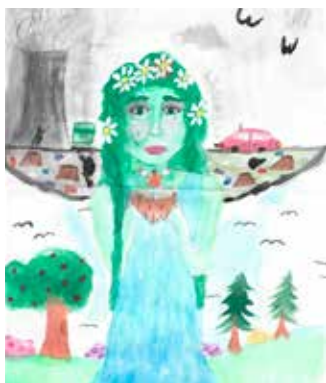
ZŠ Březinova – Zlepšení Ostravy

Úřad městského obvodu Ostrava-Jih vyhlásil regionální soutěžní výtvarnou přehlídku s názvem Evropa, ve které chci žít – Ostrava-Jih, součást mozaiky Evropy 2050. Vybrané práce se stanou součástí mozaiky regionů v rámci projektu Evropa 2050.