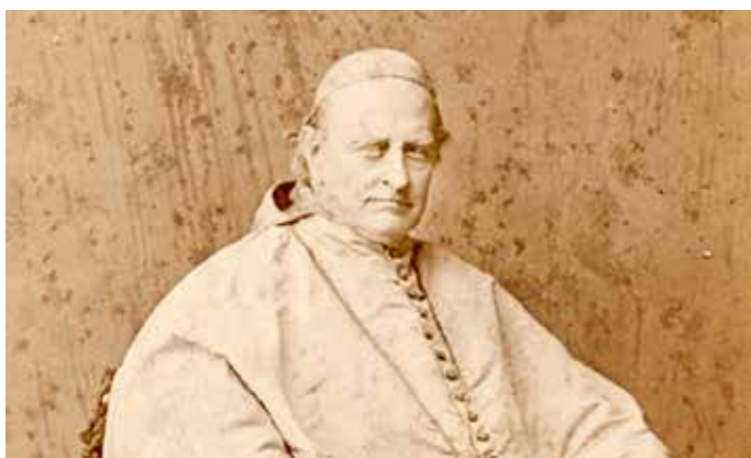
Bedřich Egon kardinál z Fürstenberka, šestý olomoucký arcibiskup, po němž byl důl pojmenován.

Od dubna 1902 do konce října 1904 bylo z jam vyčerpáno neuvěřitelných 3 422 957 m 3 vody. Od 4. do 24. března 1904 rozebrali