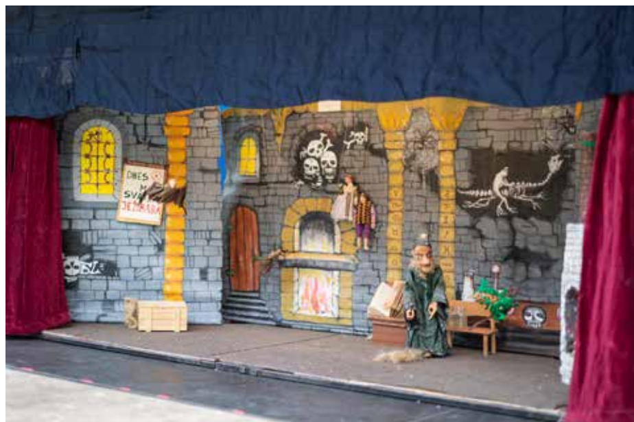
Scéna z představení loutkového Divadla babky Miládky

AK: Všechno, co potřebuji, mám. Nicméně mým snem je zřídit si doma malý chov slepiček. Celá rodina je ale proti a nabídli mi, abych si raději pořídil loveckého psa. Tak mám od ledna osmiměsíční border teriérku Elišku.