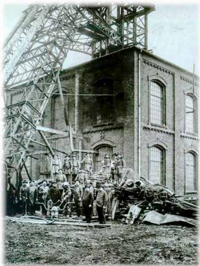
Potápěči u těžní jámy dolu Bedřich.

Roku 1905 byly budovány objekty pro kompresory, ventilátory a nové těžní zařízení. Vrtání dna větrné jámy začalo opět 10. ledna 1906. Podařilo se snížit hladinu vody na úroveň 20 metrů nad dnem větrné jámy. Nižší již čerpadla nedosáhla. Instalovaná přídatná pumpa se neosvědčila a v hloubení se nedalo pokračovat. Při pracích byly v hloubkách 384, 390 a 402 metrů nalezeny strojním zařízením rozsekané části těl tří havířů, kteří zde zahynuli v dubnu 1902.